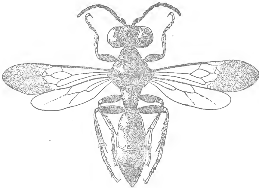
FIG. 1. — Miscophus deserti Berland, n. sp.

une pilosité argentée sur cette bordure ; tête et thorax avec une fine pilosité argentée cachant la sculpture du tégument. — Tête grosse, face longue et bombée, côtés internes des yeux presque parallèles, très légèrement divergents vers le bas ; bord antérieur du clypéus régulièrement arqué, avec une petite échancrure de chaque côté ; ocelles petits, l'antérieur un peu plus gros que les postérieurs, ceux-ci séparés entre eux, et du bord interne des yeux, de plus que leur diamètre, le groupe des ocelles plus long que large, éloignés du bord occipital d'un peu moins que la largeur du groupe des ocelles. Ailes : cellule radiale petite, courte, à peine deux fois plus longue que large, son angle distal arrondi, la nervure radiale épaisse. Sa cellule cubitale petite, sa partie pétiolée presque aussi longue que les côtés, ou que la hauteur, du triangle constituant la cellule cubitale, la base de celle-ci courbe, à peine plus longue que les côtés au triangle, la 2 e portion de la nervure cubitale plus longue que la 1 re , mais égale à l'espace qui la sépare de la 1 re nervure récurrente. Les tibias I ont quelques longues épines, peu nombreuses, formant peigne.